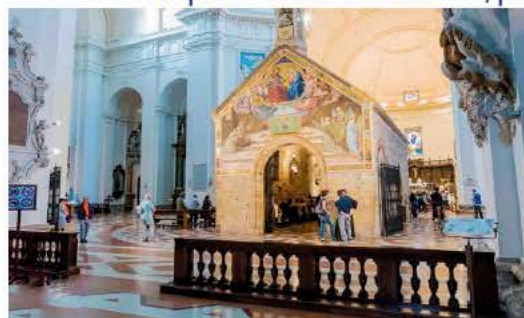
2. aprile, giornata ad Assisi. si inizia con visita e preghiera alla Porziuncola ...