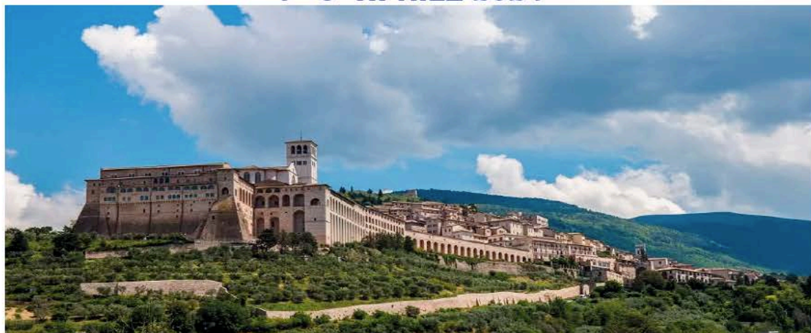
1. Aprile - Partenza da Milano, pranzo all'Abbazia de La Verna e arrivo ad Assisi

I N F O R M A Z I O N I E I S C R I Z I O N I I N S E G R E T E R I A