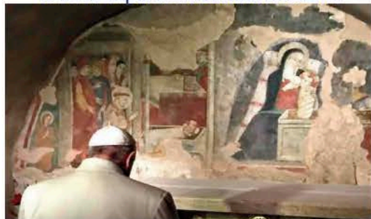
4. aprile: escursione a Greccio e visita al primo presepe voluto da San Francesco.