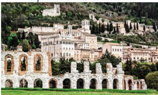
3. aprile. Mattinata a Gubbio e pomeriggio alla scoperta dell'Eremo delle Carceri.