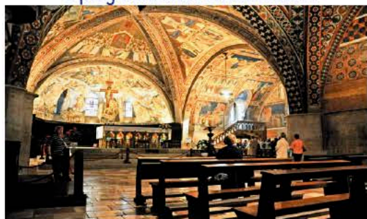
... al corpo e alle reliquie del Santo, custodite nella cripta della Basilica inferiore.