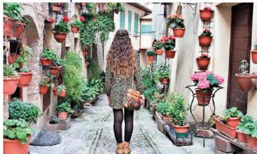
5. aprile: sulla via per Milano, tappa a Spello, uno tra i borghi più belli e fioriti d'Italia.